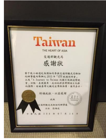
104 年度競賽成果紀錄-黃于庭同學受邀至美國紐約參與交通部觀光局駐紐約辦事處舉辦之 20015 年「GTT 旅遊說明會」以及「A Journey to Taiwan 較錄片放映造勢晚會」活動-擔任表演嘉賓