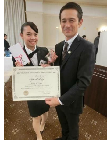
104 年度競賽成果紀錄-2015 Yokohama International Cocktail Competition (2015 橫濱盃國際調酒大賽)榮獲特別賞