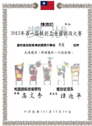
101 年度競賽成果紀錄-2012 第一屆桃創盃創意全國調酒大賽-金牌