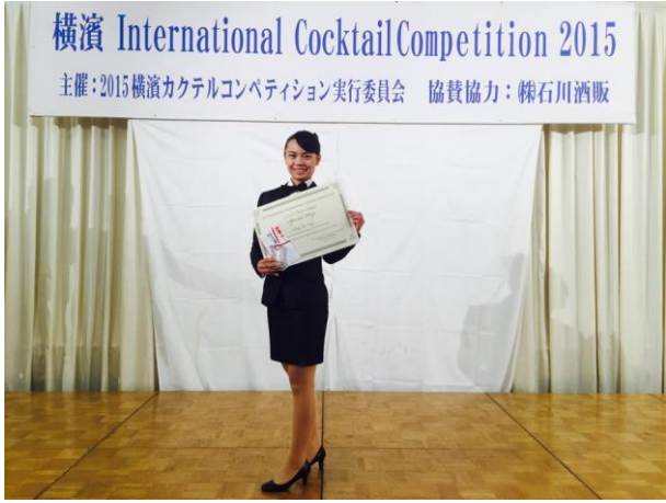
104 年度競賽成果紀錄-2015 Yokohama International Cocktail Competition (2015 橫濱盃國際調酒大賽)榮獲特別賞