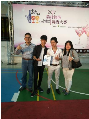
106 年度競賽成果紀錄-2017 年農村酒莊盃調酒大賽-單人花式調酒組金手獎