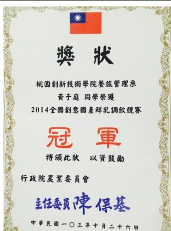
103 年度競賽成果紀錄-2014 全國創意國產鮮乳調飲競賽-冠軍