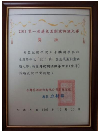
100 年度競賽成果紀錄-2011 第一屆蓬萊盃創意調酒大賽-佳作