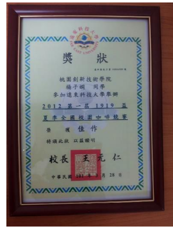
100 年度競賽成果紀錄-2012 第一屆 1919 盃咖啡競賽佳作