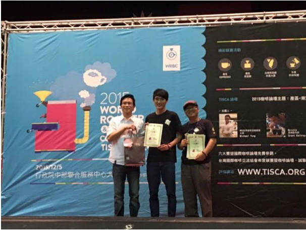
104 年度競賽成果紀錄-2015 台灣烘焙師年度大賽-亞軍