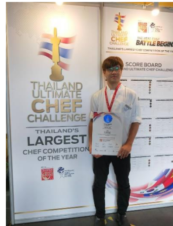
106 年度競賽成果紀錄-2018 年 TUCC 泰國終極廚師挑戰賽 4 Different Individually Western Plated Desserts (Diploma)佳作