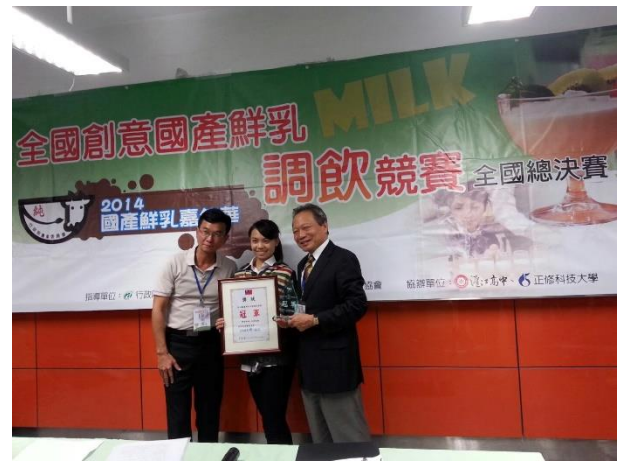
103 年度競賽成果紀錄-2014 全國創意國產鮮乳調飲競賽-冠軍