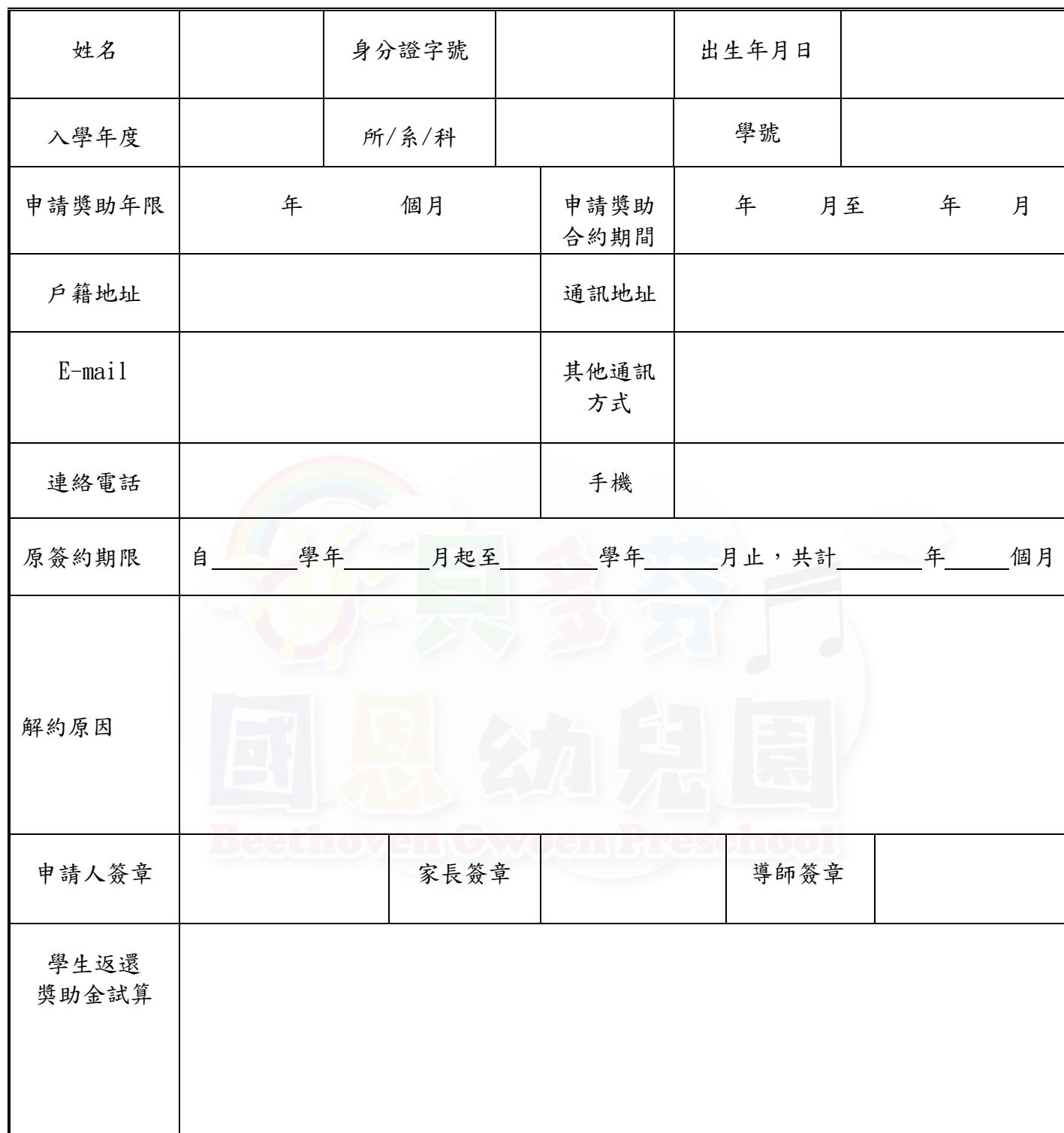
(附件四) 貝多芬國恩教育機構培育優秀人才獎學金解約申請表