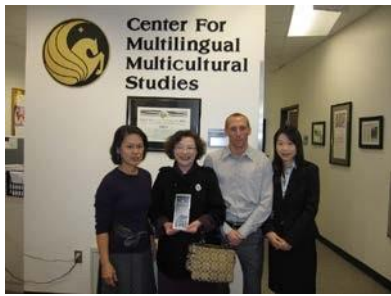
美國University of Central Florida 互訪交流