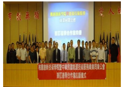
與中華民國能源技術服務商業同業公會(ESCO)等產業公協會簽訂MOU