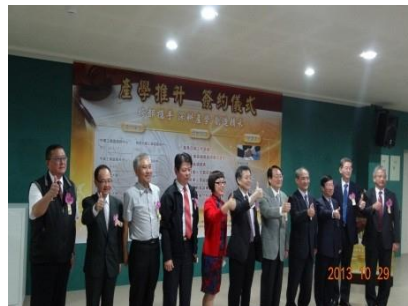
與桃苗工業區聯盟(中壢、龜山、平鎮、新竹等產業園區)簽訂MOU