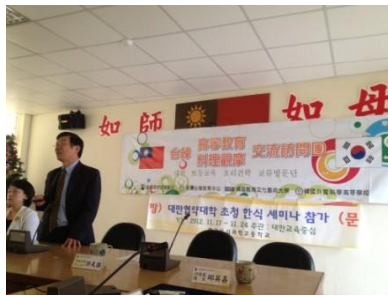
韓國數碼藝術大學、外食科學高等學校蒞校交流