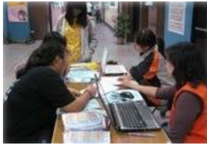
中壢就服站駐點服務