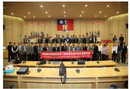
泰國清邁教育局34 區長官及高中校長蒞校交流