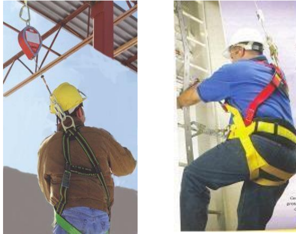
圖 2、高架作業安全帶之示意圖