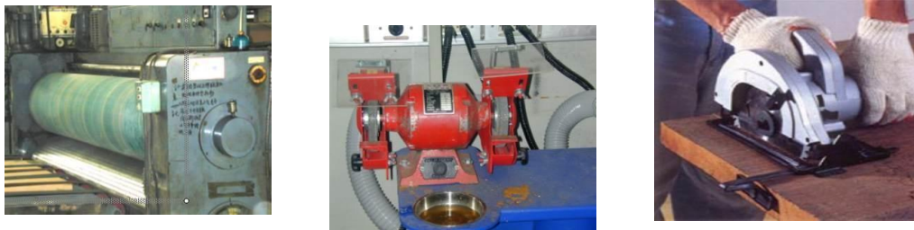
圖 1、常見之機械危害類型

員工在操作危險性機械設備前，應接受完整之職前教育訓練，詳閱操作說明及確認各項功能是否正常。平時應做好自動檢點及檢修，萬一不小心意外發生，應立即切斷動力來源及消除內部殘留動力、電源等，緊急通報廠內其他人員或主管，並立即進行必要之醫護程序和送醫急救等。