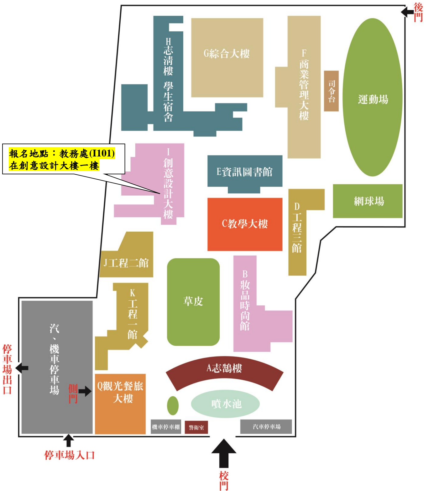
南亞技術學院校園平面圖